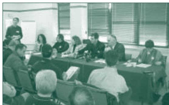
Les représentants des familles lors de la conférence de presse tenue à Montréal en octobre dernier.

Les membres de la Fédération attendent avec impatience des gestes concrets de la part du ministre de la Santé et des Services Sociaux par suite du dépôt,