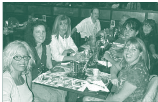
Plusieurs parents s'étaient donné rendez-vous pour une soirée festive dans un restaurant de Montréal en septembre dernier.

La croissance de popularité du site Web de la Fédération et de son forum de discussion ne semble pas vouloir ralentir. Le mois de novembre 2002 fracasse tous les records de fréquentation avec un total de 6 633 visiteurs différents. Nos statistiques indiquent également pour ce même mois 10 424 visites (soit 1,57 visites par personne) et plus de 89 793 pages visitées! Depuis le lancement du nouveau site en octobre 2001, celui-ci a reçu la visite d'internautes en provenance de plus de 50 pays.